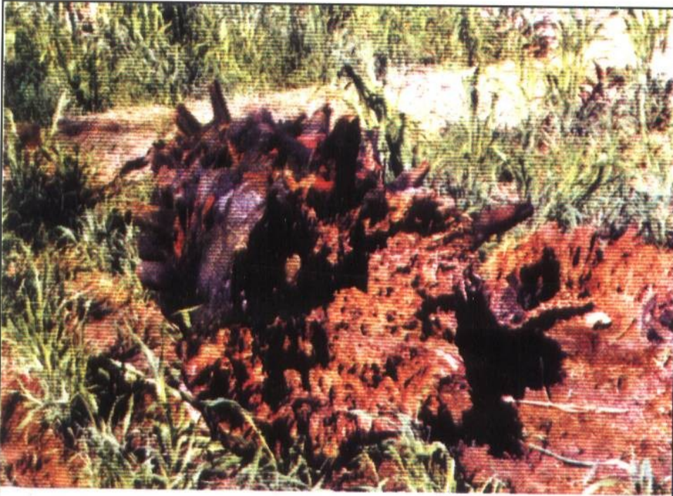
ملحق صورة رقم (3)

سقوط النخلة بفعل الإصابة الشديدة بسوسة النخيل