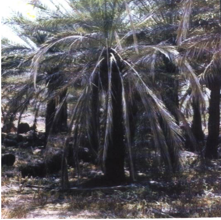
ملحق صورة رقم (5) الإهمال في خدمة النخيل