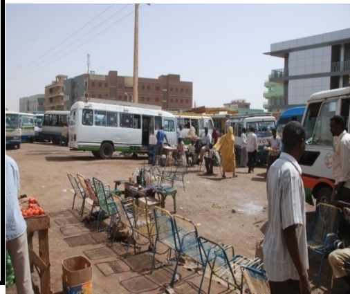
صور لمواقف ولاية الخرطوم