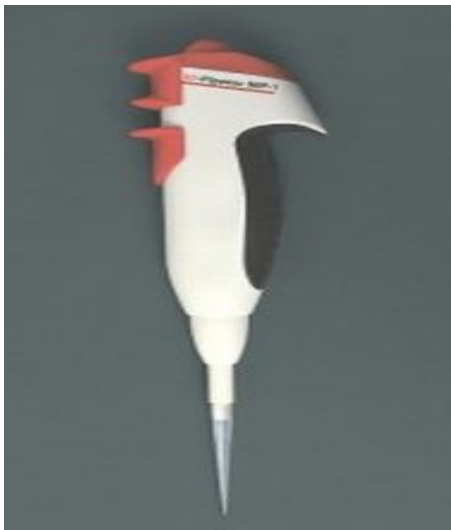
(b) ID- pipette.