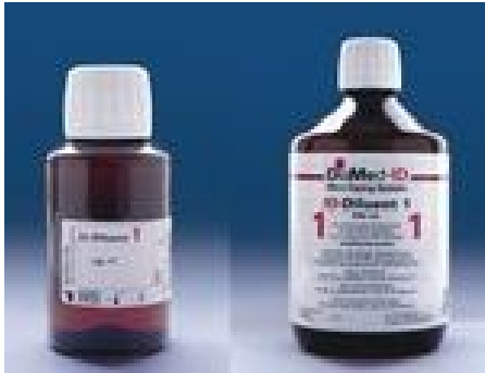
(a) ID- Diluent 1.