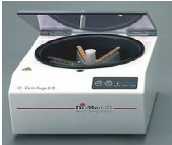
(d) ID- centrifuge.