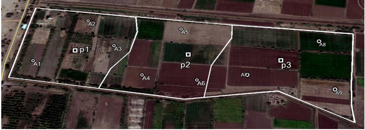
خريطة تبين مواقع أخذ العينات