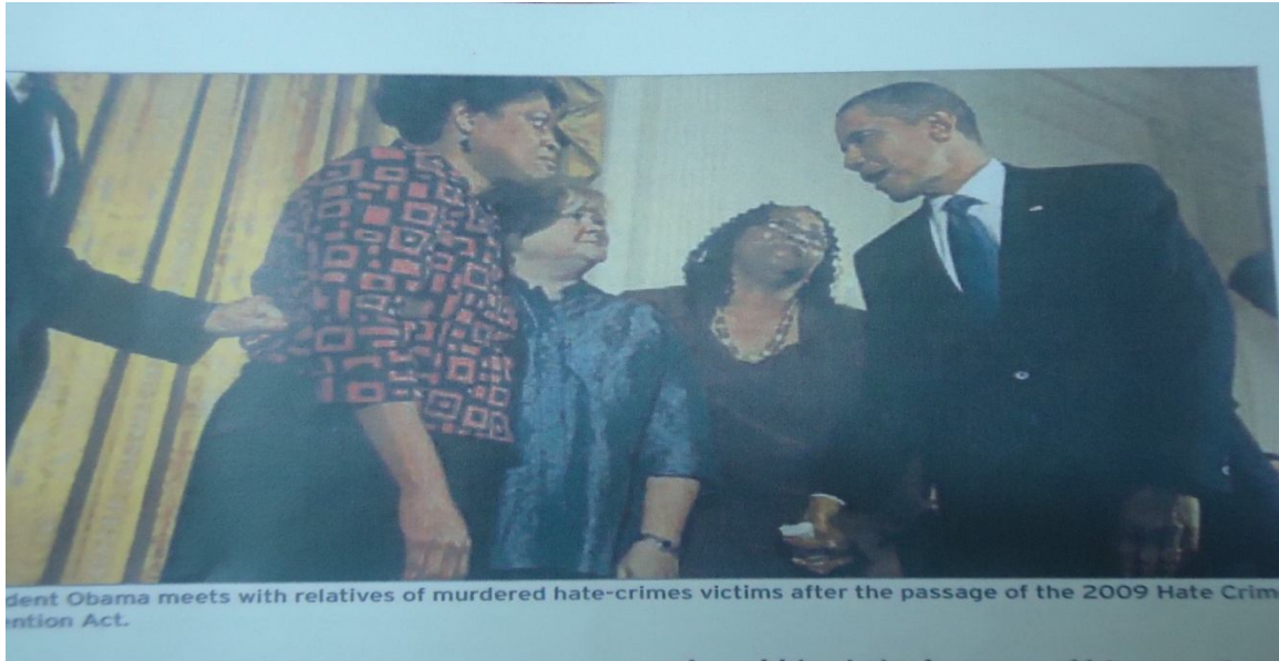
يلتقي الرئيس أوباما بأقرباء ضحايا قتل جرائم متعلقة بالاكراه بعد إجازة قانون منع جرائم الاكراه 2009

لكن المحكمة أعادت قضيتي إليوت وأومرا لمحكمة الموضوع. وأن تعاد محاكمتها وأن يدانا بموجب قانون فرجينيا إذا أثبت المدعى أنهما يقصدا ترويع الأسرة.