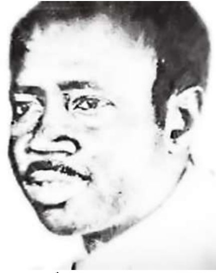
شكل رقم (1) المغني ابراهيم موسى أبا