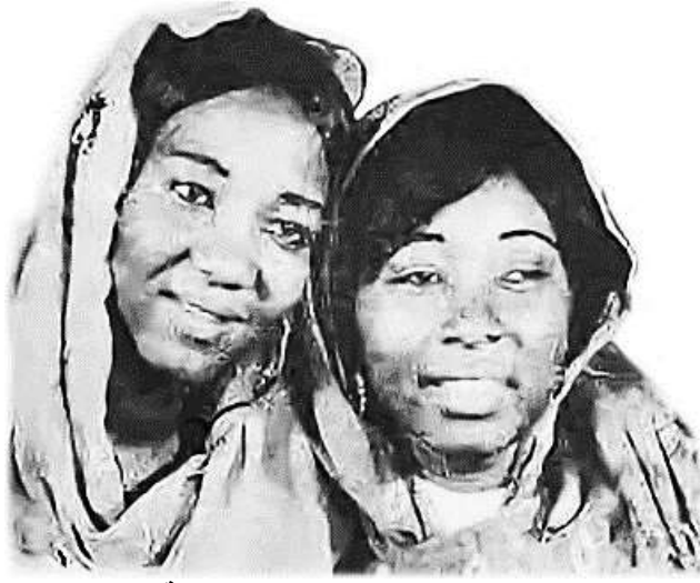
شكل رقم (2) ثنائي النغم