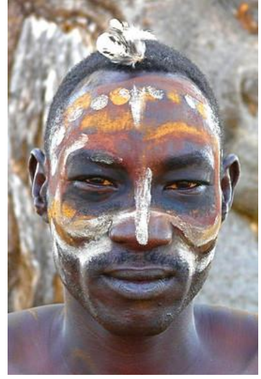
صور رقم 7. نماذج من المكياج الكامل