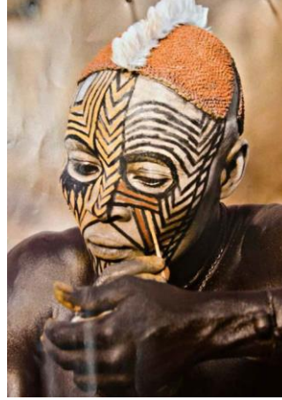
الطواقي القماشية والجلدية المُزينة بريش جداد الوادي أو بحبات السبح

ت. الألوان المستخدمة في المكياج عند النوبة الكوايب وسيكلوجية دلالاتها