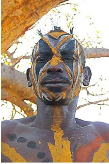
صور رقم 6. نماذج من مكياج الوجه باللونين الأبيض والبني