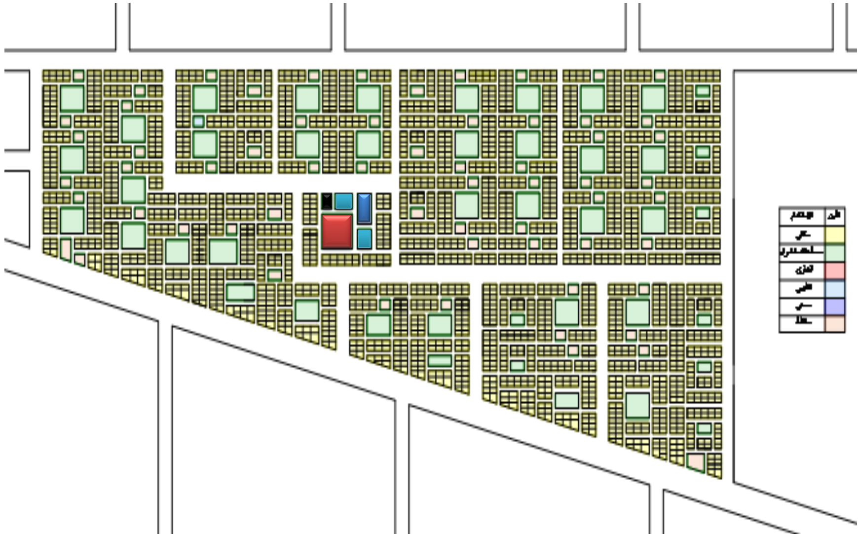
(خريطة رقم (1-3-3) توضح المخطط التنظيمي المقترح لحلة محجوب)