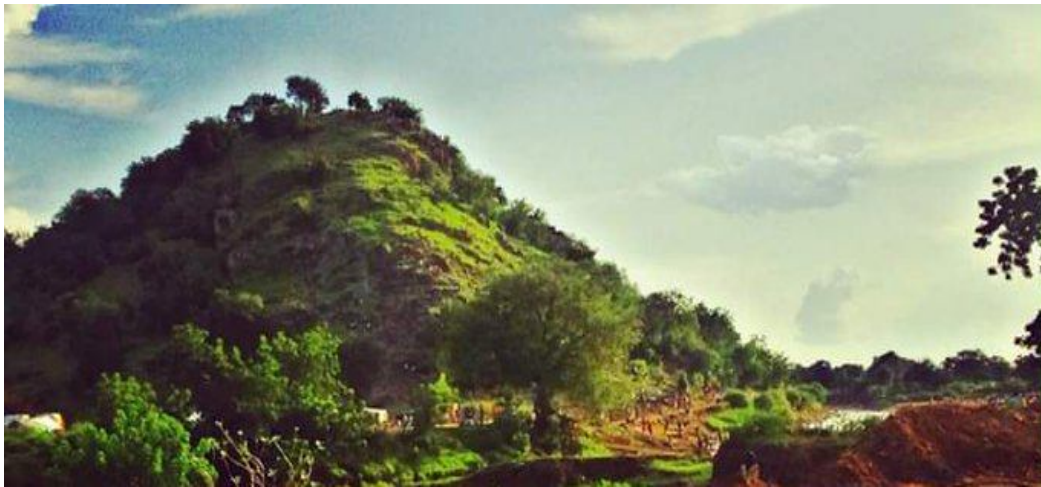
صور لمنطقة أبو جبيهة