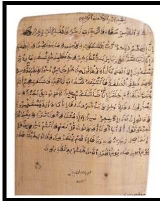
نموذج رقم: (1/2)