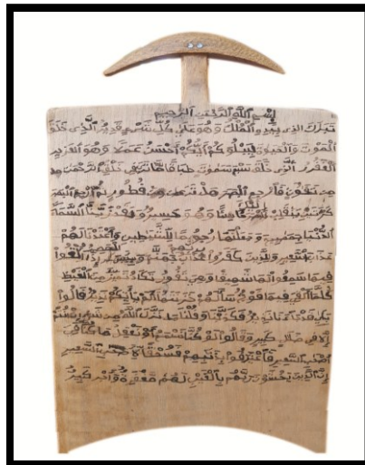
نموذج رقم: (1/2)