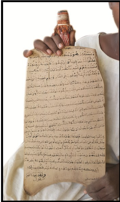
نموذج رقم: (1/1)