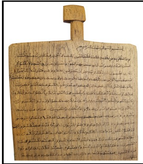
نموذج رقم: (./.)