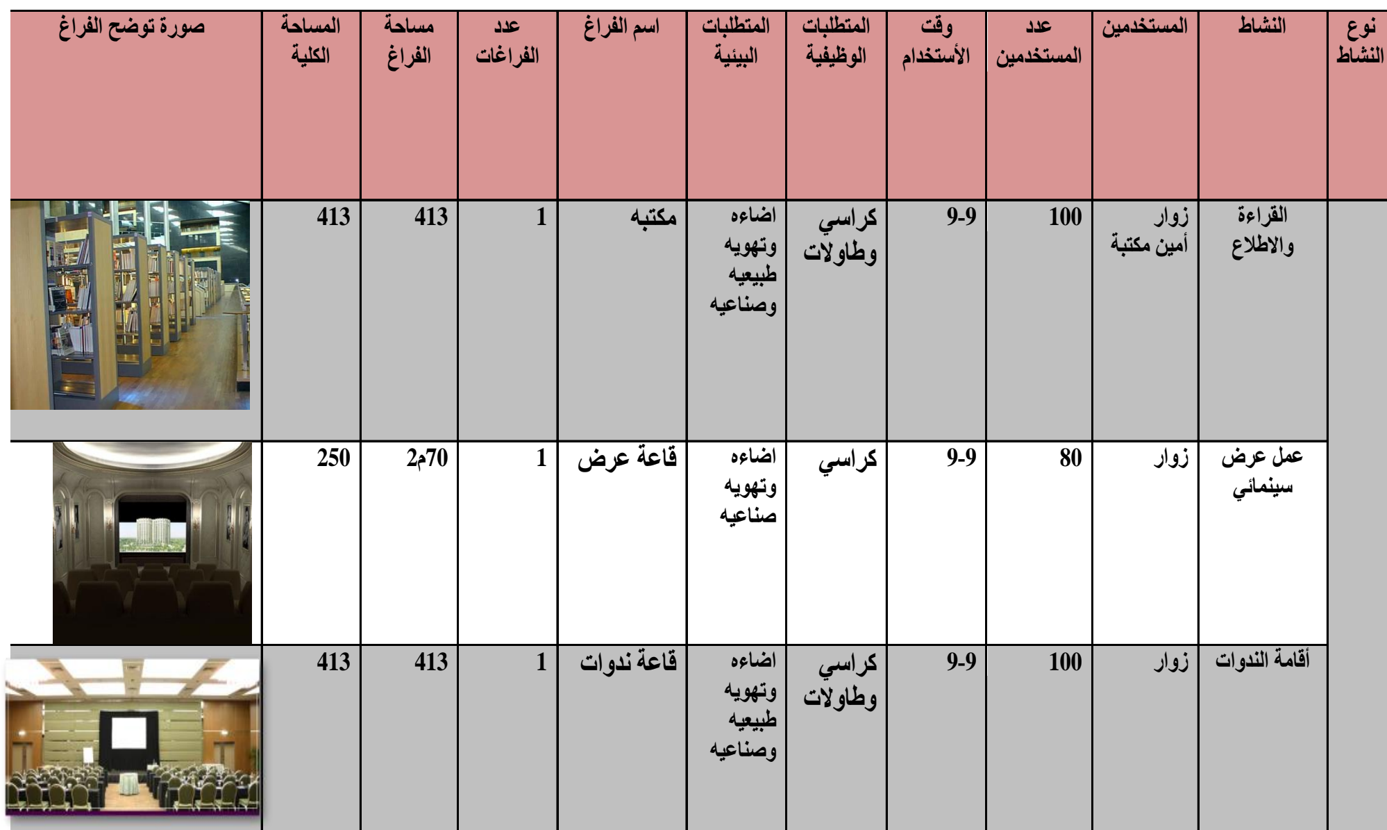
شكل رقم 52- جدول المناشط - نشاط ثقافي