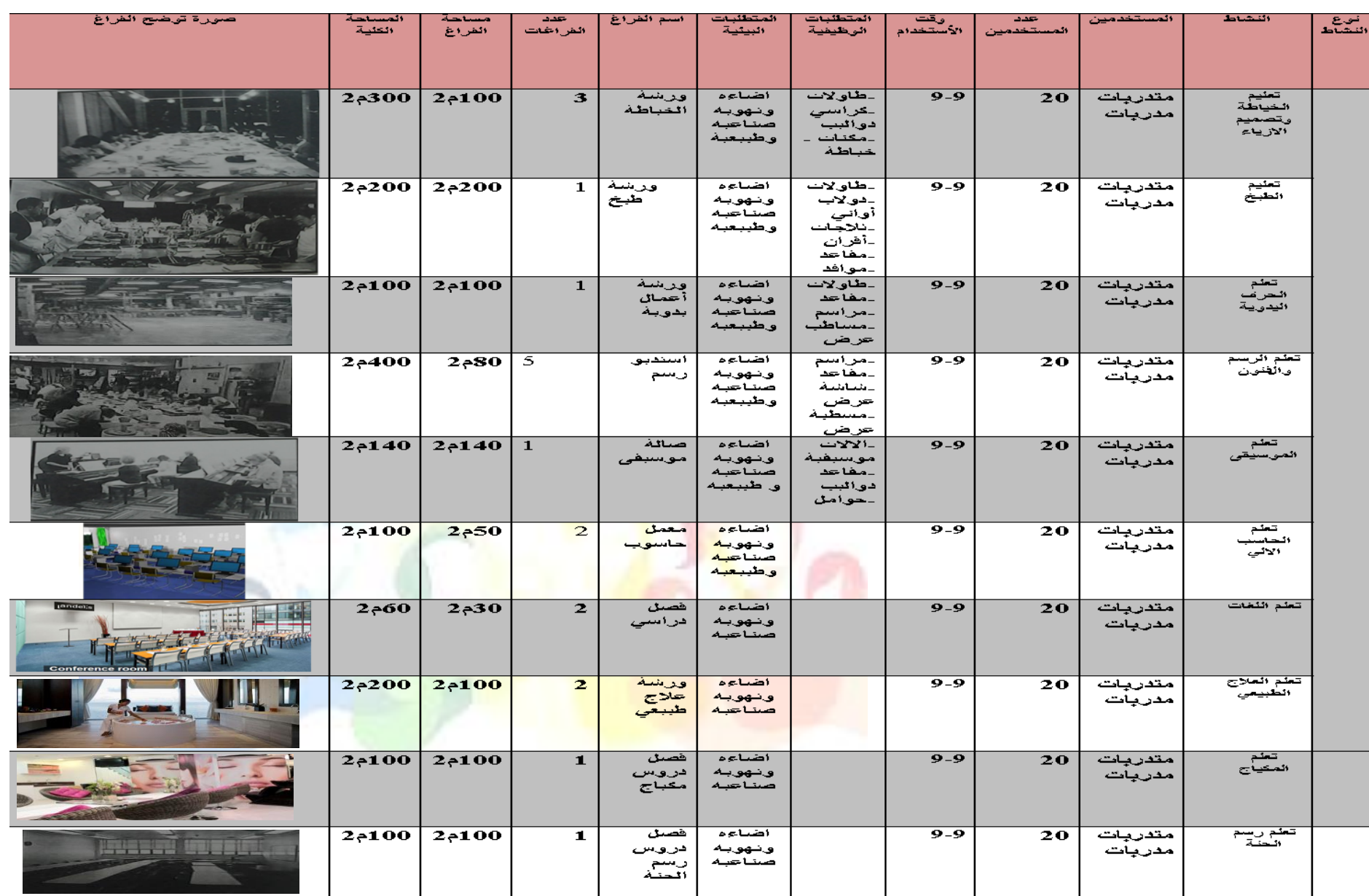
شكل رقم 51- جدول المناشط - نشاط تدريبي