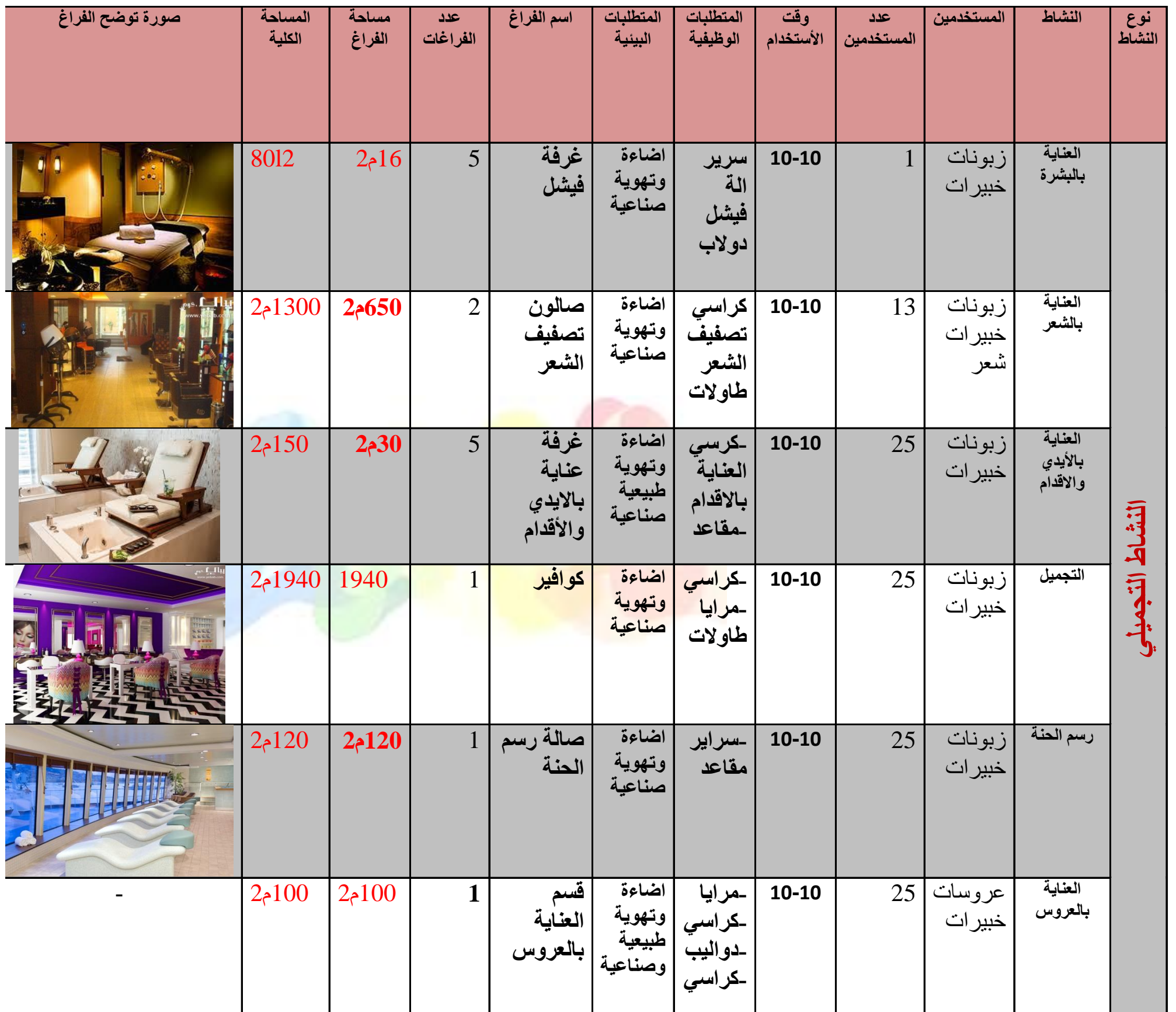
شكل رقم 53- جدول المناشط - نشاط تجميلي