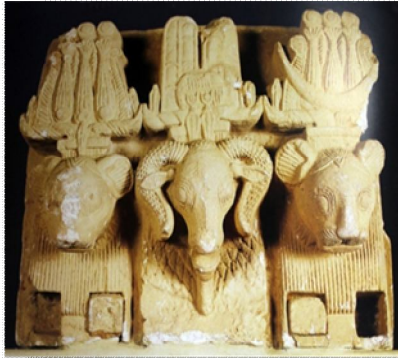
نموذج (4) الجزء الأعلى المشكل من باب أو ثلاثية بين أمون رع مع سيبيوميكرو وارنس نوفيس