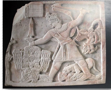
نموذج (1) الامير اريكانخارير يقض على اعداءه