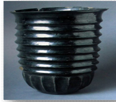
نموذج (3) كأس