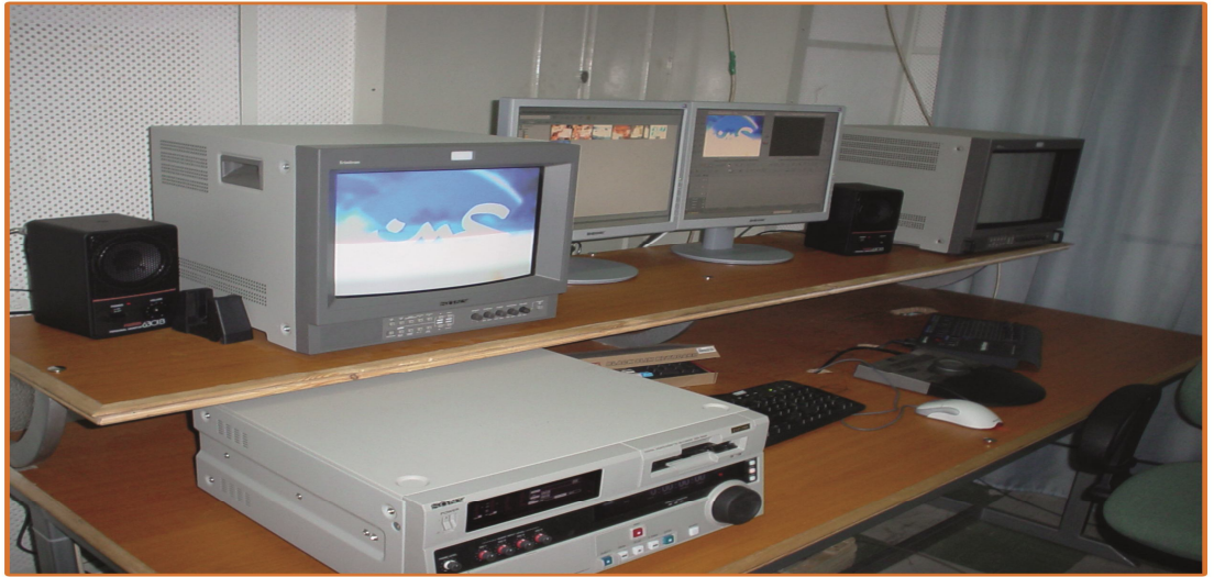
وحدة مونتاج تلفزيوني - قناة جامعة السودان المفتوحة

وحدة مونتاج - تلفزيون جامعة السودان المفتوحة