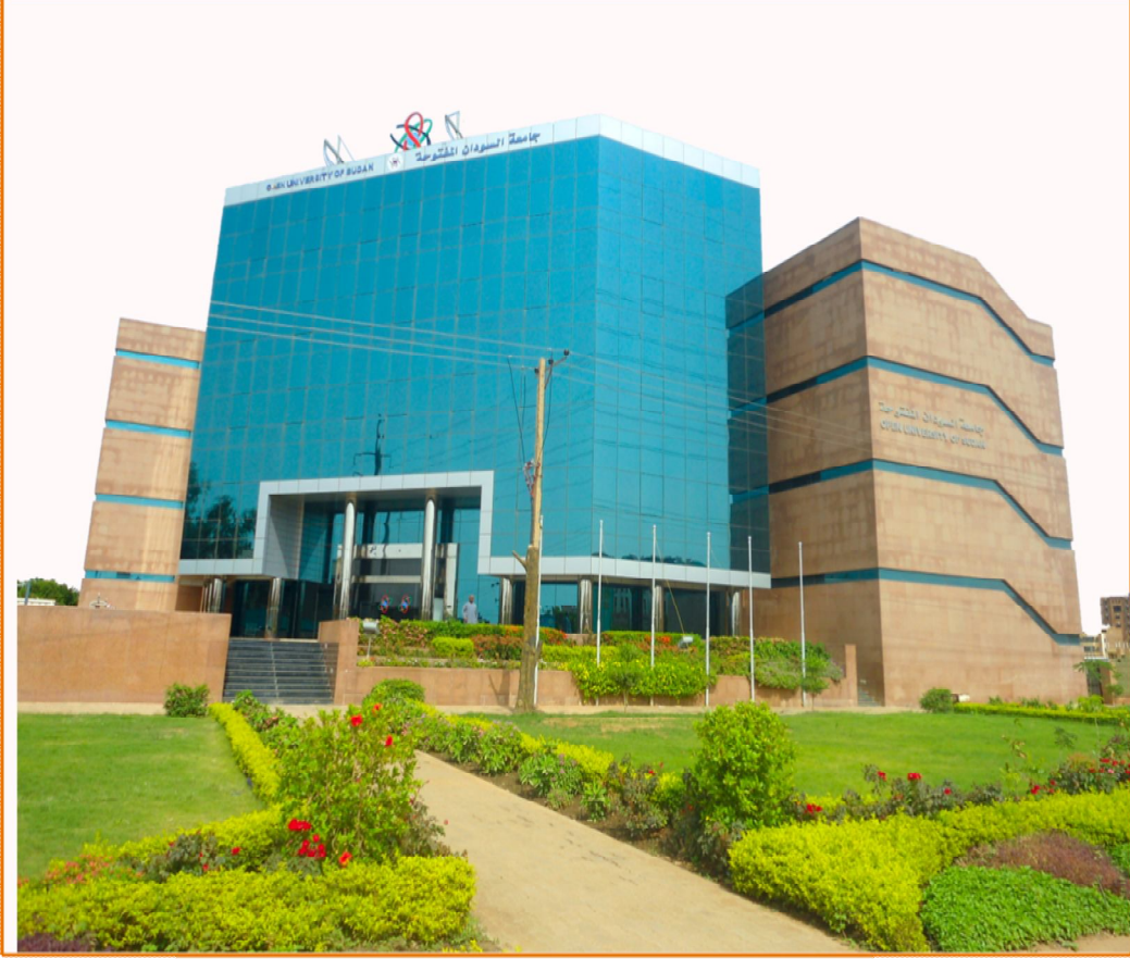
مبنى رئاسة جامعة السودان المفتوحة - الخرطوم - أركويت