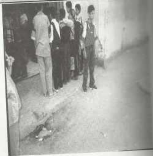
يخرج يروح المدرسة ويرجع من أمام بابها