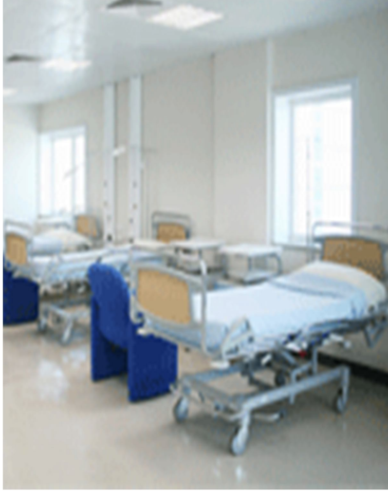
شكل رقم (7) مركز الخرطوم للعناية بالثدي