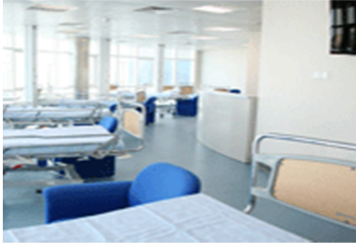
شكل رقم (6)