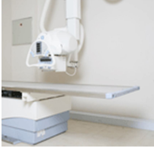
شكل رقم (5)