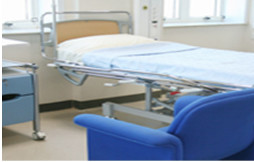
شكل رقم (3)