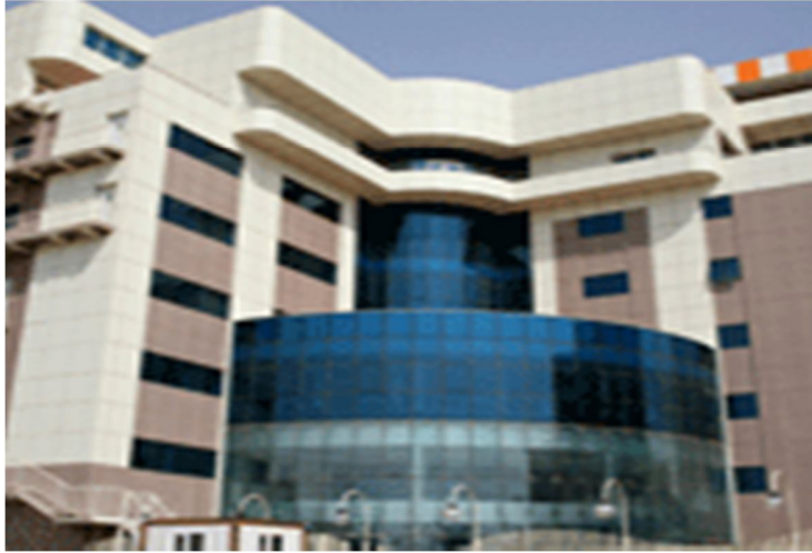
شكل رقم (1)