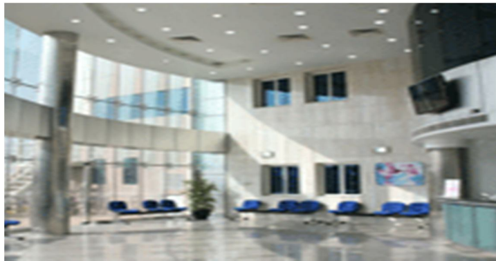
شكل رقم (2)