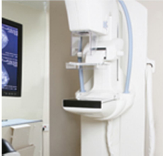
شكل رقم (4)