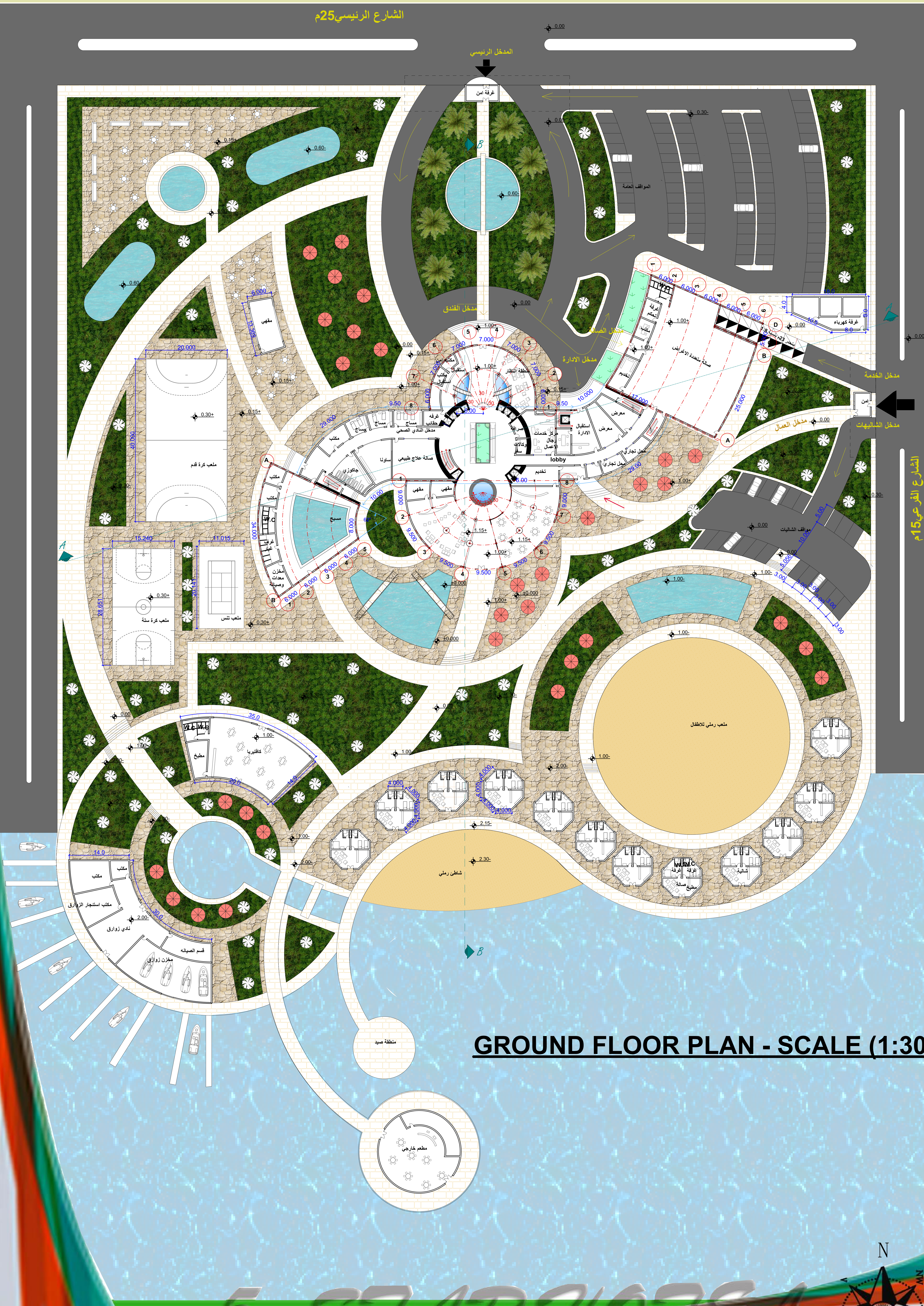
GROUND FLOOR PLAN - SCALE (1:300)