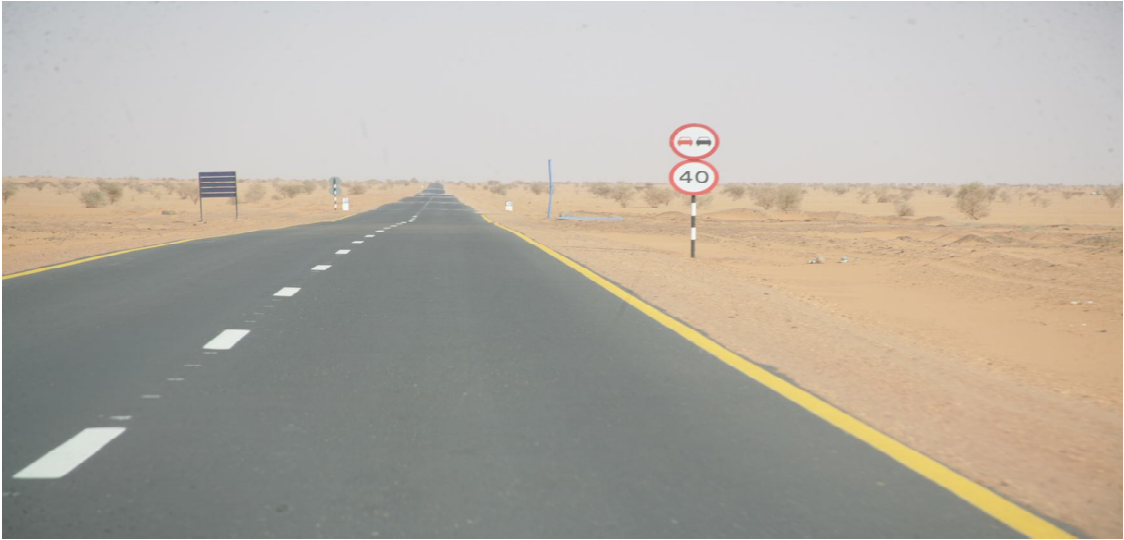
طريق شريان الشمال والذي قامت بتنفيذه الوحدة