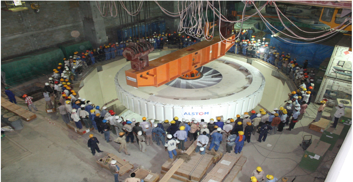
صورة توضح تركيب إحدى توربينات سد مروى العشر