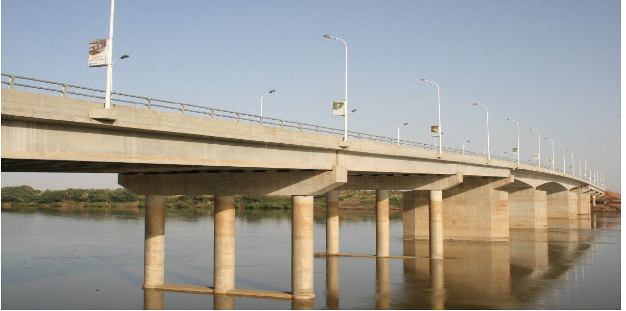
جسر كريمة/ مروى والذي قامت بتنفيذه الوحدة