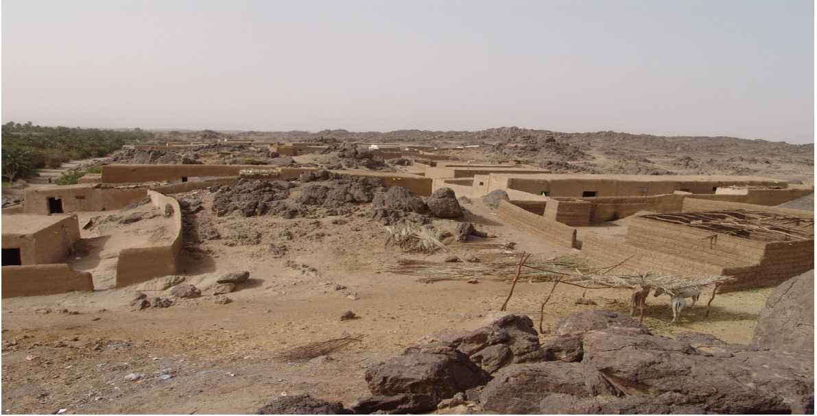
نموذج لإحدى قرى المتأثرين من قيام سد مروي في الموطن القديم