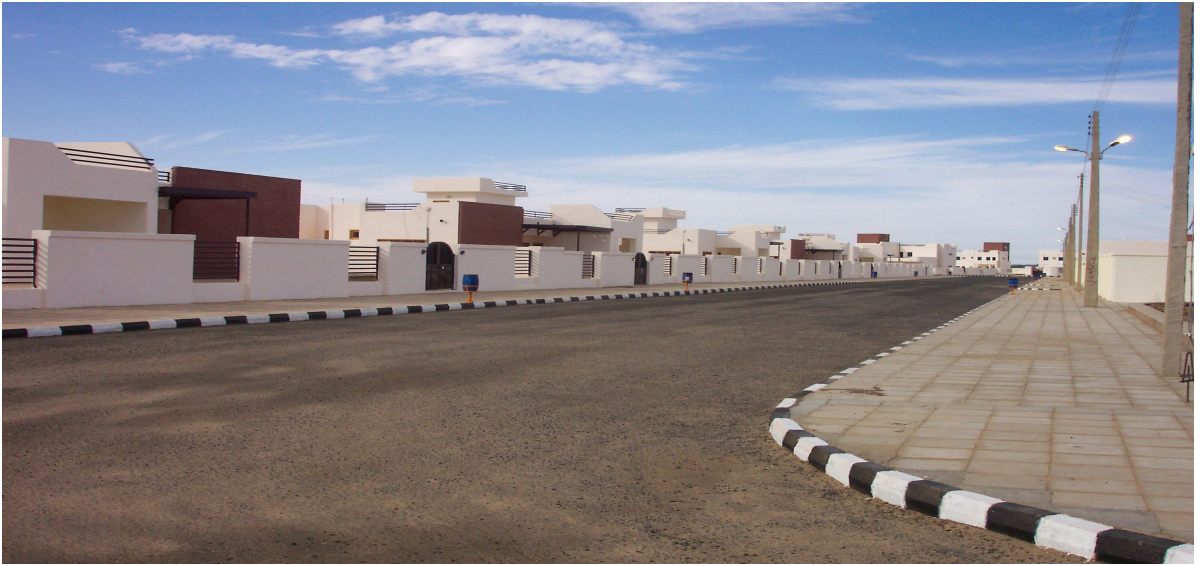
جانب من مدينة السد السكنية بمنطقة الحامداب بالولاية الشمالية