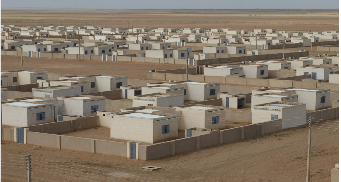
نموذج لإحدى قرى إعادة توطين الأهالي المتأثرين من قيام سد مروي