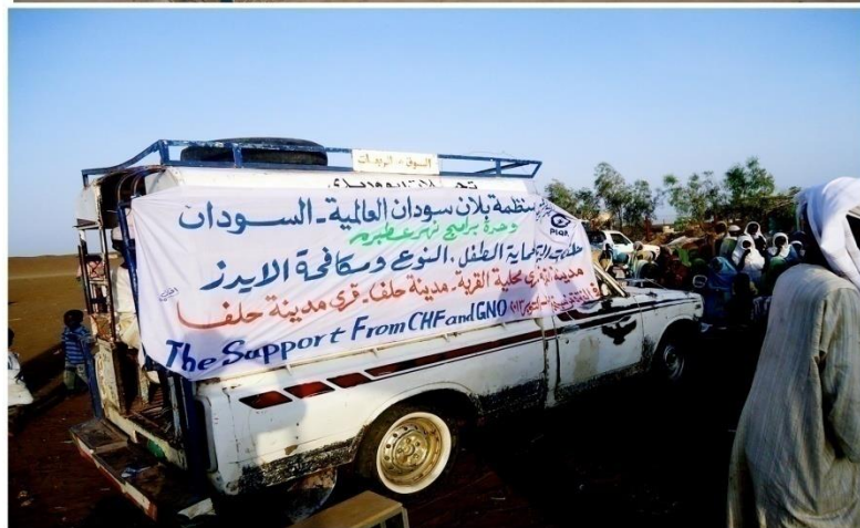
حلفا الجديدة – ولاية كسلا