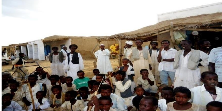
مكلي - تجربة تواصل عبر المشاركة