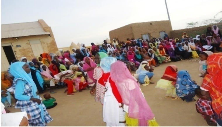
المشاركون عبر المسرح التفاعلي