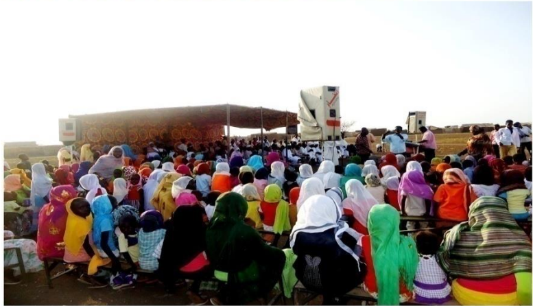
حلفا الجديدة - ولاية كسلا