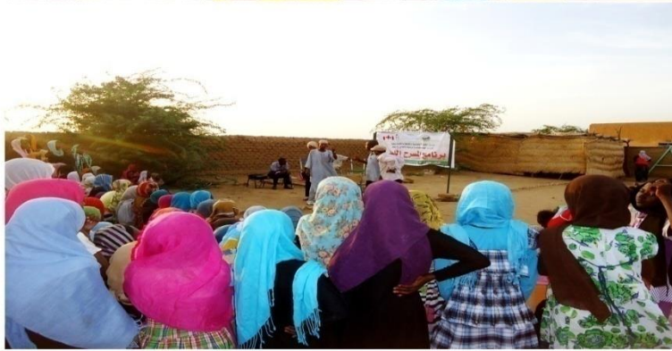
قرية عوضات - كسلا