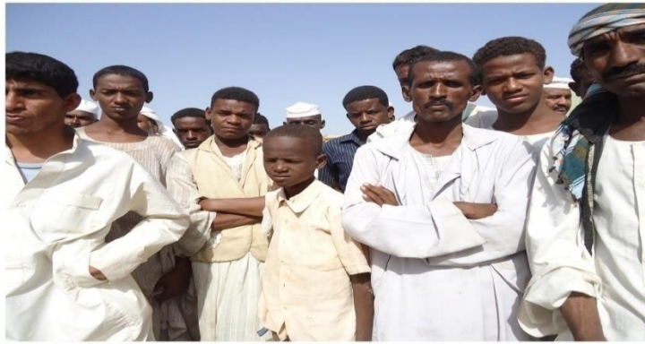
عرض مشاركة تفاعلي - مدينة حلفا الجديدة