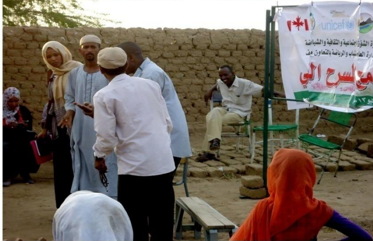
مسرح المشاركة - أقصى حدود المشاركة - قرية مكلي - ولاية كسلا 2011/3/3 م