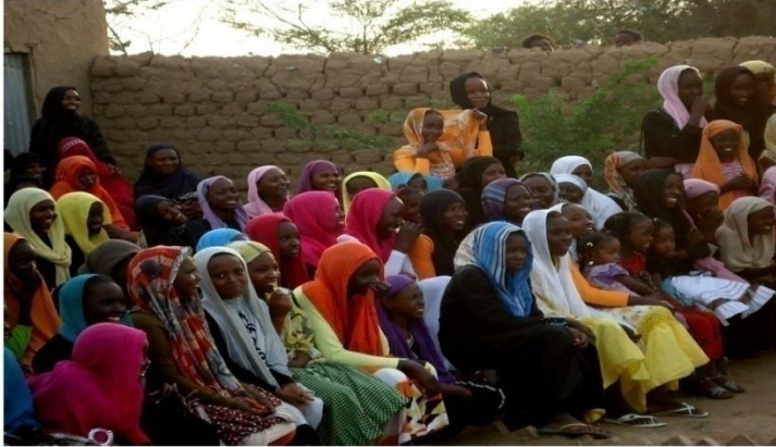
قرية عوضات - كسلا