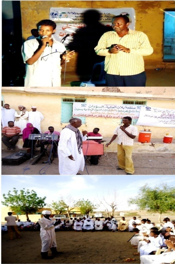
اتصال وتواصل مسرحي عبر المشاركة - مدينة كسلا - بيريبي