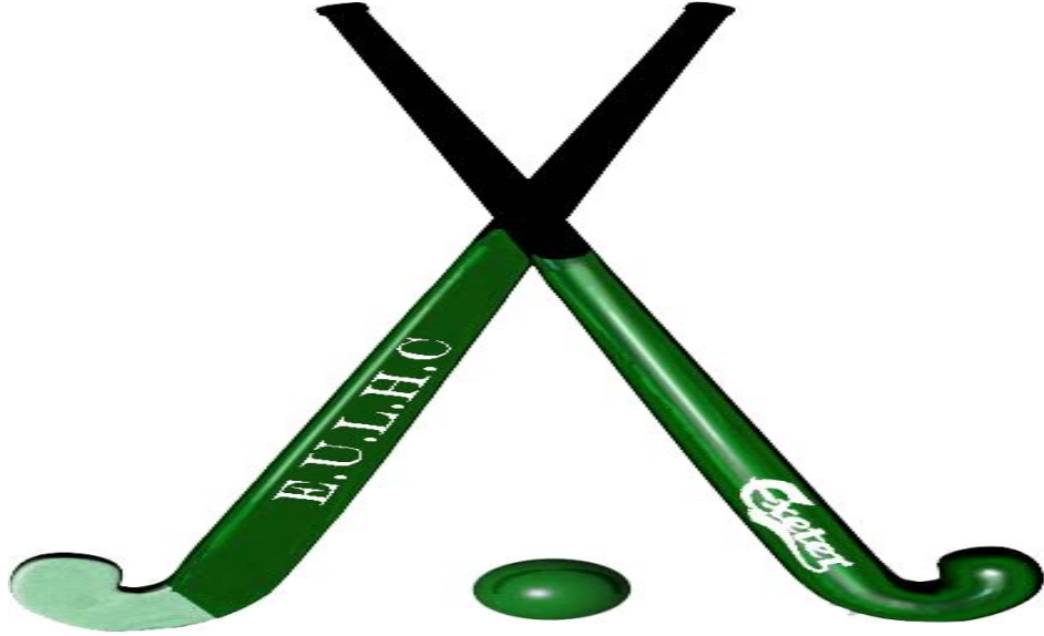
شكل رقم ( 2 ) يوضح مضرب و كرة الهوكي

أما المضارب المخصصة للسيدات فيتراوح وزن المضرب منها بين: (١٢) أوقية (٣٤٠) غراما و (٢٣) أوقية (٦٥٢) غراماً (منير علاوي، ١٩٧٧م، ص٤٦)