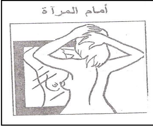
ملحق رقم (٥)