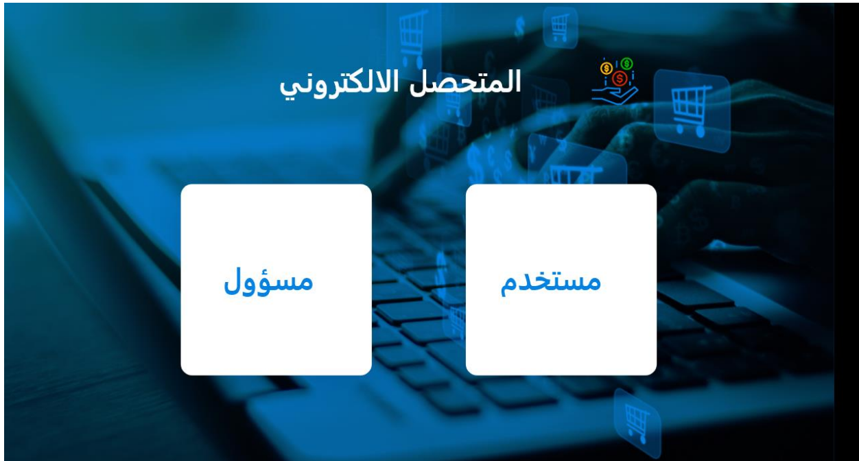
الشكل(5-1) واجهة المستخدم للموقع

الموقع مدرج باللغة العربية حتي يتيح للجميع التعامل معة بسهولة ويسر .