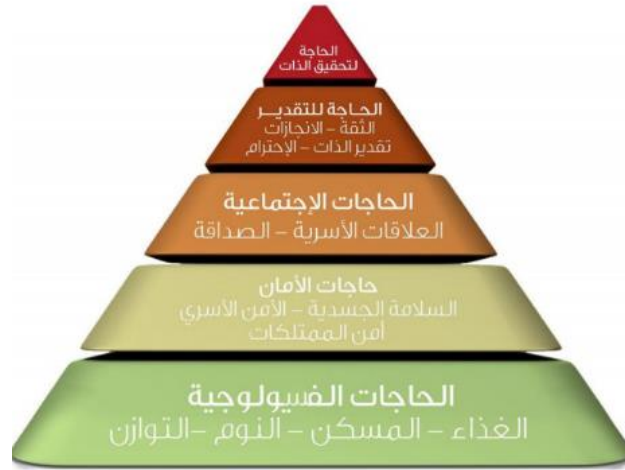
شكل "1" تدرج ماسلو للاحتياجات الإنسانية، والذي يتضمن حاجة الإنسان للامان ويعد المسكن إحدى طرق تحقيقها (المعموري، 27، 2011)

الفراغ الداخلي السكني: هو اقتطاع جزء من الفراغ العام الخارجي بمواصفات ومحددات خاصة، تجعله يصلح لأن يمارس فيه الإنسان أنشطة حياتية خاصة، وتتوقف هذه الأنشطة وطريقة أدائها على طبيعة الجزء المقطوع، وحجمه، وهيئته التصميمية وعلاقته بالفراغ العام الخارجي المحيط به (زرور، 2013م، 33).