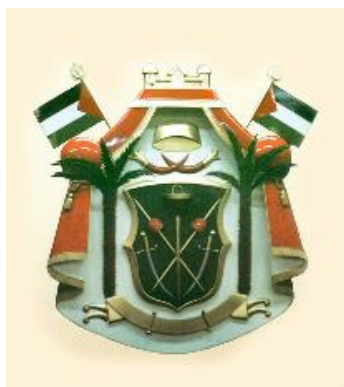
شكل رقم (15) شعار الثورة العربية الكبرى

دلالات شعار الثورة العربية الكبرى : رأس الشعار: يمثل مسجد أبي قبيس في مكة المكرمة والرايات : رايات الثورة العربية الكبرى و الوشاح الأحمر: يمثل العرش الهاشمي بألوان تمثل الفداء والصفاء والسيوف: تمثل سيوف الثورة العربية الكبرى و المغزل: يدل على انتشار الصناعة. الطاقة: تدل على انتشار الإسلام في بقاع الأرض والنخيل: يمثل منطقة شبه الجزيرة العربية .