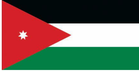
شكل رقم ( 8 ) راية المملكة الاردنية الهاشمية

راية المملكة الأردنية الهاشمية : تعد الراية الأردنية رمز العزة القومية وعنوان السيادة والحرية , ورمز كرامة المواطن التي تستحق التضحية في سبيلها .واستمدت الراية الأردنية بصورتها الحالية من راية الثورة العربية الكبرى التي انطلقت من مكة عام 1916م وتشير ألوانها الى ما يأتي :اللون الأسود: راية العقاب، وهي راية الرسول محمد - ﷺ. وقد اتخذها العباسيون شعاراً لهم واللون الأبيض: راية الدولة الأموية واللون الأخضر: راية الدولة الفاطمية، وشعار آل البيت اللون الأحمر (المثلث): راية الهاشميين منذ عهد جدّهم الشريف أبي نُمَي الكوكب الأبيض السباعي (النجمة السباعية): يرمز إلى السبع المثاني في فاتحة كتاب الله العزيز التي تتألف من سبع آيات.