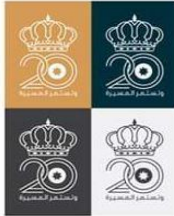
شكل رقم ( 18 ) تحليلات شعار العشرينية

وقد ركز الشعار على التاج الملكي المستخدم منذ عهد الملك المؤسس عبدالله بن الحسين، إذ يظهر التاج على علم جلالته الملك منذ عام 1929م، ويمثل التاج جلالته الملك وجماله الملكة وأفراد الأسرة الهاشمية ويرمز التاج الملكي إلى أن نظام الحكم في المملكة الأردنية الهاشمية حكمٌ ملكي وراثي. وقد صدر نظام التاج الملكي الهاشمي بمقتضى المادة (13) من قانون الأعلام الأردنية رقم (6) لسنة 2004 م بتاريخ 19 حزيران 2006م ، والذي يبين مكونات التاج وألوانه واستعمالاته. ومن دلالات التاج الملكي الهاشمي يتكون التاج من خمسة أضلاع متشابكة بحلقات ترتكز على قاعدة