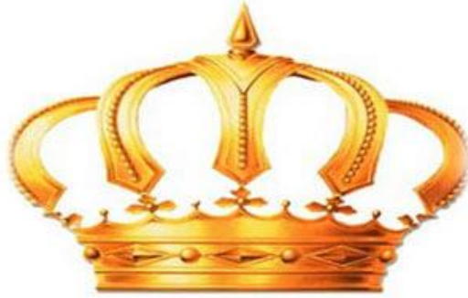
شكل رقم (19) التاج الملكي الهاشمي

مرصعة بالياقوت والزمرد، وتعلو القاعدة خمسُ زنابق ترمز للنقاء والطهر، ويعلو التاج رأسُ حربة ترمز لحربة راية الهاشميين. ب. اللون الذهبي هو اللون الرسمي المعتمد للتاج، ويمثل جلالة الملك وجمالة الملك اللون الفضي هو اللون الرسمي المعتمد للتاج، ويمثل أفراد الأسرة الهاشمية المالكة من فرع الملك عبدالله الأول، ويُسْتثنى من ذلك ذرية الإناث منهم اللواتي يتزوجن من غير فرع الملك عبدالله الأول.