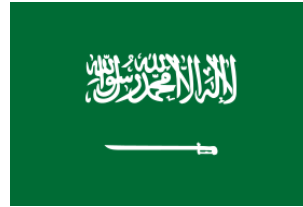
المملكة العربية السعودية :