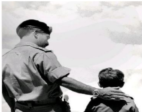
صوره رقم (20) دلالات (وتستمر المسيرة)

ولتؤكد على أن المسيرة هي درب طويل من الإصلاح والتطوير والإنجاز والبنیان في شتى الميادين لرفعة الوطن ونهضته.