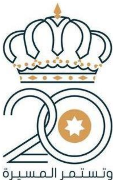
شكل رقم ( 17 ) شعار مئوية الثورة العربية الكبرى

تمر العشرون من عمر الدولة الأردنية بقيادة جلالة الملك عبدالله الثاني ليكتمل بها قرن من الإنجاز على خطى الثورة العربية ومساراتها التي تتجدد فيها المسيرة، ، ويجمع بين مفردات العلم وشعار المملكة بما هي هوية جامعة للوطن، وبما يعنى ذلك الفضاء من التقاف الأردنيين ولوائهم للتاج الهاشمي.