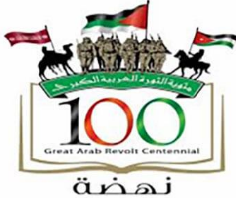
شكل رقم (16) شعار مئوية الثورة العربية الكبرى

قادها الشريف الحسين بن علي وأبناؤه الأمراء علي وفیصل وعبدالله وزید، إلى جانب أحرار العرب الأبطال الذين انضموا لصفوف الثورة بوصفها حركة تحرر قومية تتشدد استقلال العرب ويقتطهم ووحدتهم ونهضتهم. وبمناسبة هذه الاحتفالات، تم إطلاق شعار مئوية الثورة العربية الكبرى المستمد من موحياتها وتاريخ المملكة الأردنية الهاشمية.