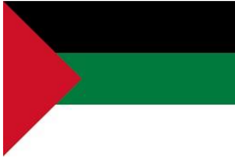
شكل رقم (7) راية الثورة العربية الكبرى

ويملك الأردن راية الثورة العربية الكبرى بنموذجها الأصلي، وهي واحدة من رايتين بقيتا منذ بدايات انطلاق الثورة العربية الكبرى، بينما توجد الراية الأخرى في المتحف الحربي الإمبراطوري في لندن. وصمّم هذه الراية، التي صنّع منها عدد قليل في تلك الفترة، الشريف الحسين بن علي، قائد الثورة العربية الكبرى. وكان الأردن قد استعاد هذه الراية، التي كانت تُعرض في قاعة "سودبي" في لندن المختصة بالمقتنيات التراثية العريقة والقديمة، بناءً على توجيهات ملكية.