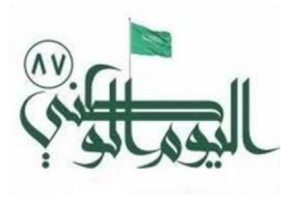
شكل رقم ( 5 ) اليوم الوطني السعودي 87

تعتبر المملكة العربية السعودية من الدول ذات النظام الملكي التي تحتفل سنوياً بمناسبات وطنية عده منها اليوم الوطني وعند التحليل للشعارات الشكل رقم (5) نجد العناصر الاتية الحروف والخطوط المكتوبة بالخط الكوفي التي تحتوي على العديد من الزوايا الحادة احياناً والرشيقة في احيان اخرى بتشكيل هندسي جميل متداخل يؤكد على تداخل قطاعات الدولة وتشابك سكانها بحالة اجتماعية فريدة ولنجد العلم السعودي مرفرفاً عالياً خفاقاً في قمة الشعار وعلى الجهة اليسرى نجد الرقم 87 ليؤكد على ترتيب المناسبة بألوان خضراء وبيضاء مشتقة بشكل مباشر من العلم السعودي وفي الشكل رقم (6) نجد حاله من التطوير في الشكل حيث يتكون من خطوط جمالية مرتبة بتراتب مدروس لتشكل شكل الخريطة السعودية