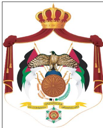
شكل رقم ( 12 ) شعار المملكة الاردنية الهاشمية

شعار المملكة الأردنية الهاشمية : يعبر عن هبة الدولة ويرمز إلى جذورها التاريخية ويشهد على مراحل تطورها السياسي. وشهد شعار المملكة الأردنية الهاشمية تحدياً على مراحل عدة؛ بما ينسجم مع أهميته ومكانته واستعمالته، فقد قرر مجلس الوزراء تثبيت أوصاف الشعار ودلالاته بالقرار رقم (3531) الصادر بتاريخ 21 شباط 1982. وصدرت الإرادة الملكية لصاحب الجلالة الملك الحسين بن طلال بالموافقة على إجراء تعديلات على الشعار وتثبيت أوصافه بتاريخ 7 شباط 1987. وفي عهد صاحب الجلالة الملك عبدالله الثاني ابن الحسين، صدر نظام شعار المملكة الأردنية الهاشمية بتاريخ 19 أيلول 2006، مبيناً مكونات الشعار ودلالاته واستعمالته ومواصفاته وقياساته وألوانه.