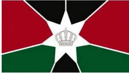
شكل رقم ( 11 ) علم سمو ولي العهدالشعارات الأردنية الهاشمية

الفاطميين. ويحمل اللون الأخضر رمزية إضافية كونه مرتبطاً تقليدياً بالإسلام والمسلمين الحزمة الحمراء: تمثل سلالة الهاشميين والثورة العربية الكبرى.