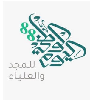
شكل رقم ( 6 ) اليوم الوطني السعودي 88