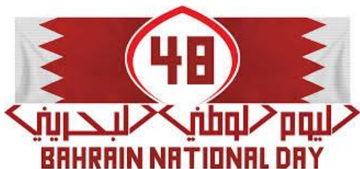
شكل رقم ( 2 ) اليوم الوطني البحريني 48