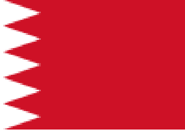
شكل رقم ( 4 ) علم مملكة البحرين