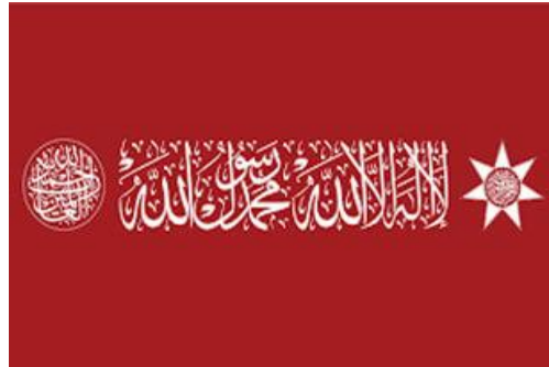
شكل رقم ( 9 ) الراية الهاشمية

الراية الهاشمية : الراية الهاشمية هي الراية التي سلّمها صاحب الجلالة الملك عبدالله الثاني ابن الحسين إلى القوات المسلحة الأردنية-الجيش العربي بمناسبة عيد الجلوس الملكي ويوم الجيش والثورة العربية الكبرى بتاريخ 9 حزيران 2015، في باحة قصر الحسينية؛ لتتضمّن إلى رايات وأعلام القوات المسلحة الأردنية-الجيش العربي بهدف الدفاع عن المبادئ السامية لرسالة الإسلام والثورة العربية الكبرى وحفاظاً على الشرعية والإنجاز .