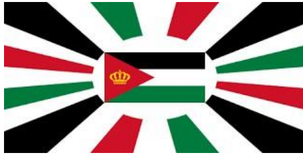
شكل رقم (10) علم جلالة الملك المعظم

علم جلالة الملك المعظم : يحمل علمُ جلالة الملك رمزيةً خاصةً كونه العلم الشخصي لجلالته، ويُعدّ ثاني الأعلام في المملكة الأردنية الهاشمية وفقاً لما نُشر في العدد رقم (217) من الجريدة الرسمية الصادر بتاريخ 1 كانون الأول 1929، يكون طوله ضعف عرضه، وتوضع في وسطه راية شرق الأردن، كما يحدّد شكلها في القانون الأساسي مصغرةً لثلث حجم لواء سمو الأمير، وتكون راية شرق الأردن الوطنية ضمن إهليلج أبيض يلامسها 24 شعاعة على الدائر.