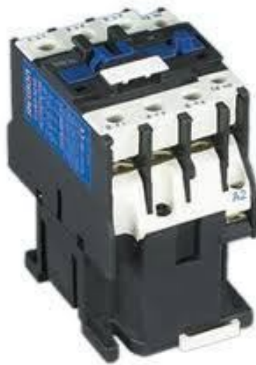
(1-3-2) شكل يوضح رمز الكونتاكاتور

وهو مكون من جزئين الجزء السفلي به قلب حديدي ثابت علي شكل حرف (E) يوجد حول الضلع الاوسط ملف سلك معزول (بوينة) وحول الضلعين الاخرين حلقة واحدة مغلقة من النحاس او الالمونيوم لتقوية المجال المغنطيسي علي الجانبين اما الجزء العلوي فيحتوي علي قلب حديدي متحرك له نفس الشكل ومركب عليه مجموعة نقاط تلامس وعادة تكون مكونة من ثلاث نقاط رئيسية في وضع فصل وعدد غير محدد من نقاط التلامس المساعدة منها المفتوح و منها المغلق فاذا وصل التيار الي البوينة يحدث مجالا مغناطيسيا يجذب القلب العلوي الي اسفل تجاه القليب الثابت فيتغير وضع جميع نقاط التلامس فتصير النقاط المفتوحة مغلقة والنقاط المغلقة مفتوحة وتظل هكذا حتي ينفصل التيار عن البوينة فيعود القلب المتحرك علي وضعه الطبيعي مندفع الي اعلي بقوة ياي موجود بين القلبين فتعود جميع نقاط التلامس الي وضعها الاصلي