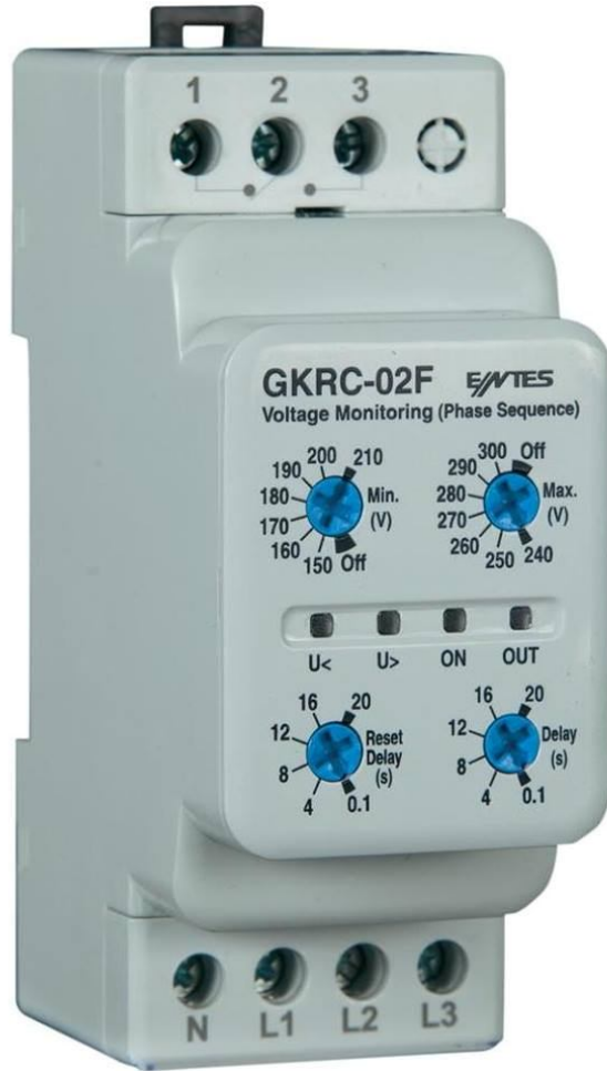
(3-3-2) شكل يوضح رمز الحساس

تتصل الاطراف A1-A2 بمصدر تغذية تبعا لفولت الريلي وتتصل الاطراف B1-B2 باطراف سلك يربط بنهاية اي ثقل معدني وسيط .B1 طرف رئيسي يلامس السائل في كل الاحوال وبالتالي يكون اسفل الخزان والطرف B2 يوضع عند اعلى نقطه للمستوى المراد والطرف B3 يوضع عند نقطة اقل مستوى مراد ويتغير وضع نقطة التلامس 15-16-18 عند وصول السائل الى اعلى او اقل مستوى .ويحتوي الريلي على مقاومة متغيرة يمكن بواسطتها التحكم في تغيير المستوى وبتحديد معينه دون الحاجة الى تغيير وضع الاثقال المتصلة بالاطراف B2-B3.