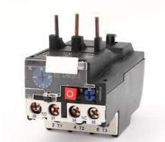
(2-3-2) شكل يوضح رمز الاوفرلود

وظيفة الاوفرلود الاساسية هي حماية المحرك من اي ارتفاع في شدة التيار وهو مكون من ثلاث ملفات حرارية تتصل بالتوالي مع المحرك وله تدرج لشدة التيار يضبط هذا التدرج على نفس قيمة تيار المحرك وفي حالة ارتفاع شدة التيار التي يسحبها المحرك على القيمة المضبوط عليها تدرج الاوفرلود لاي سبب اذا كان زيادة حمل او سبب سقوط فاز تؤدي هذه الزيادة الى ارتفاع حرارة الملفات الحرارية فتتمدد وتحرك قطعة من الفيس فتفصل نقطة مغلقة داخل الاوفرلود وهذه النقطة تتصل بالتوالي مع بوبينة الكونتاكتور الذي يعمل على هذا المحرك فيفصل نقاط تلامسه الرئيسية وينقطع التيار عن المحرك. وبعد معرفة سبب الانقطاع بسب ارتفاع في شدة التيار واصلاحه يضغط على زر فتعود نقطة تلامس الاوفرلود مغلقة ويمكن اعاده تشغيل الدائرة مرة اخرى.