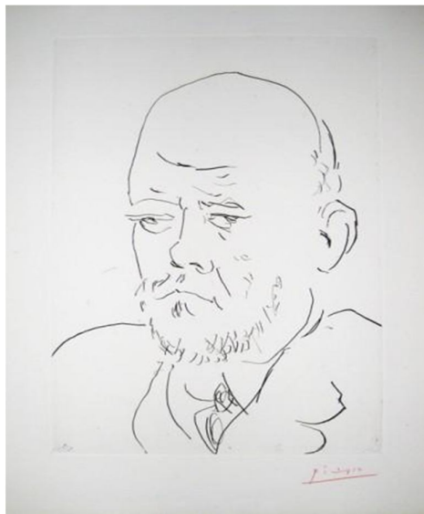
بيكاسو، 1937م، حفر مباشر بالإزميل