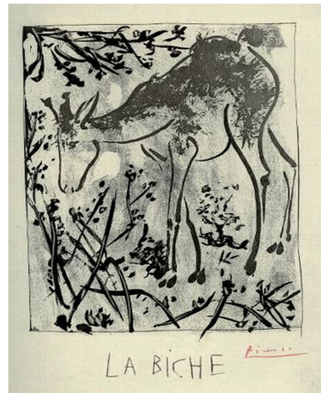
بيكاسو، الطيبة 1942م، حفر على الزنك بالأحماض