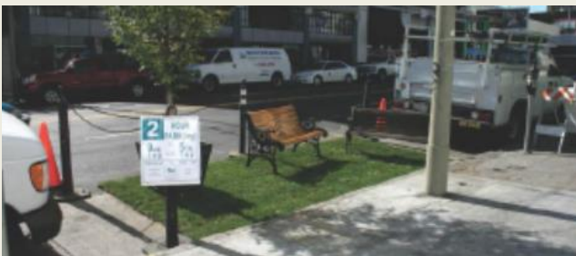
(المصدر Tactical urbanism - Mikel Lydon & Anthony Garcia 1)