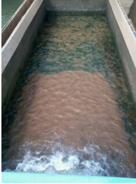
صورة رقم (3): المرشح الرملي