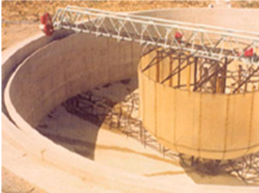
صورة رقم (2): اجزاء المرسب