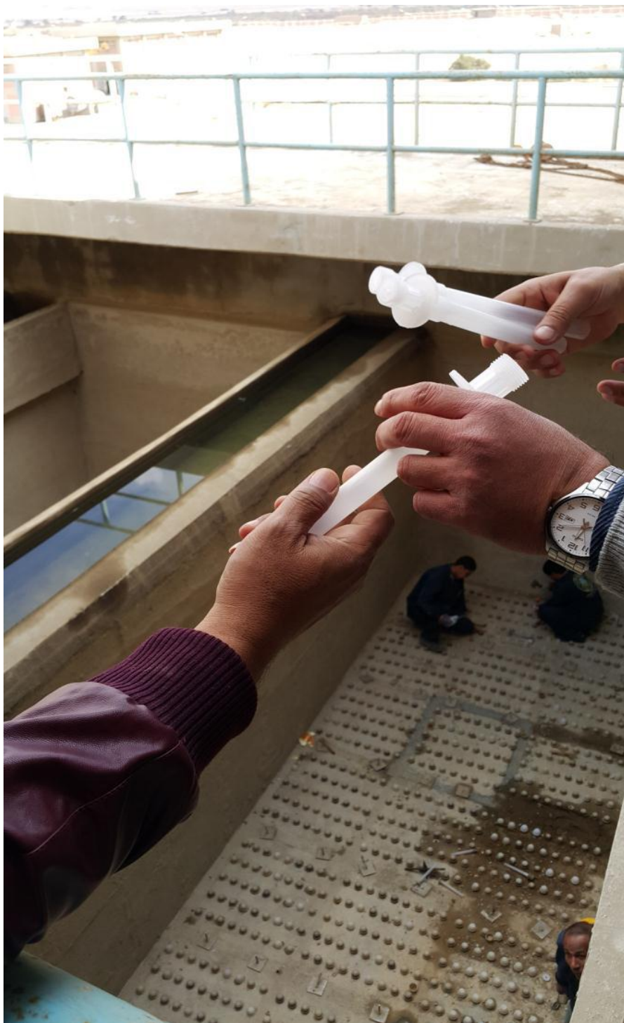
صورة رقم (8): غير الفوهات في أحواض الترشيح