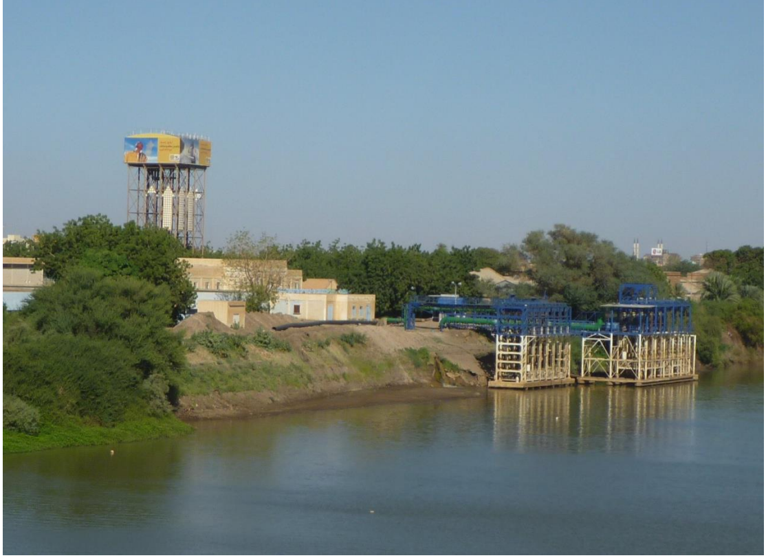
صورة رقم (1): المأخذ