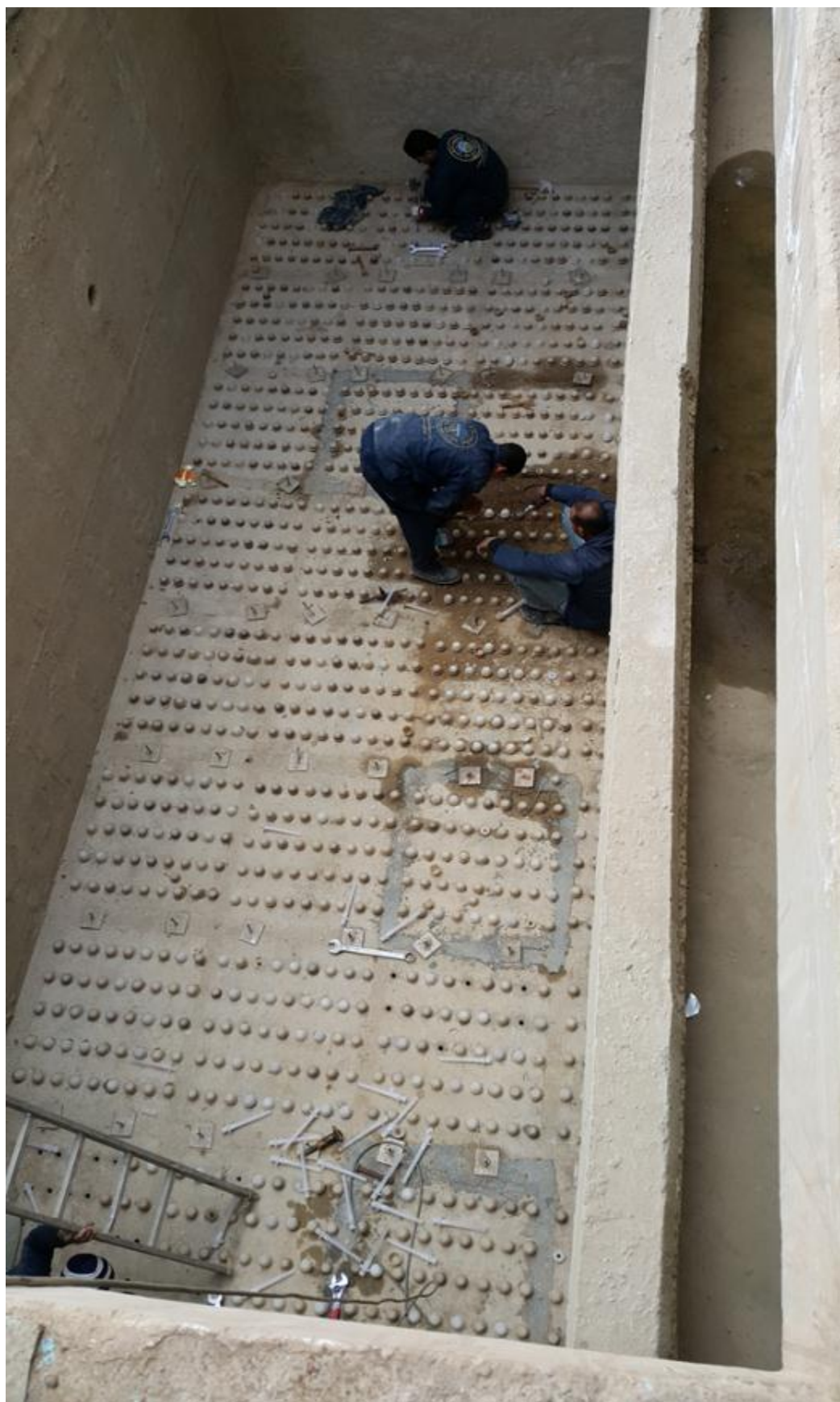
صورة رقم (9): احواض الترشيح الجديدة