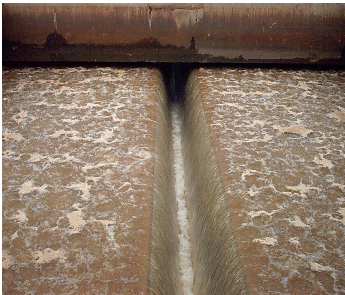
صورة رقم (5): الغسيل العكسي