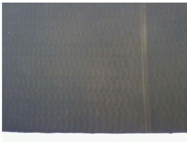
صورة رقم (6): اللامبلا في أحواض الترسيب