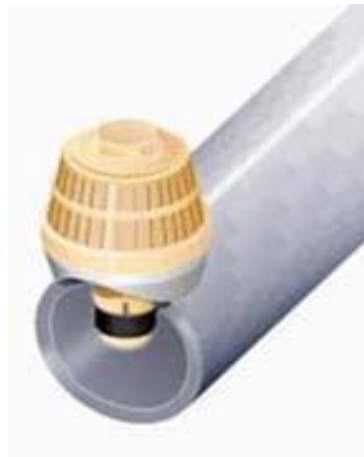
شكل رقم (4): الفوهات (Nozzles)